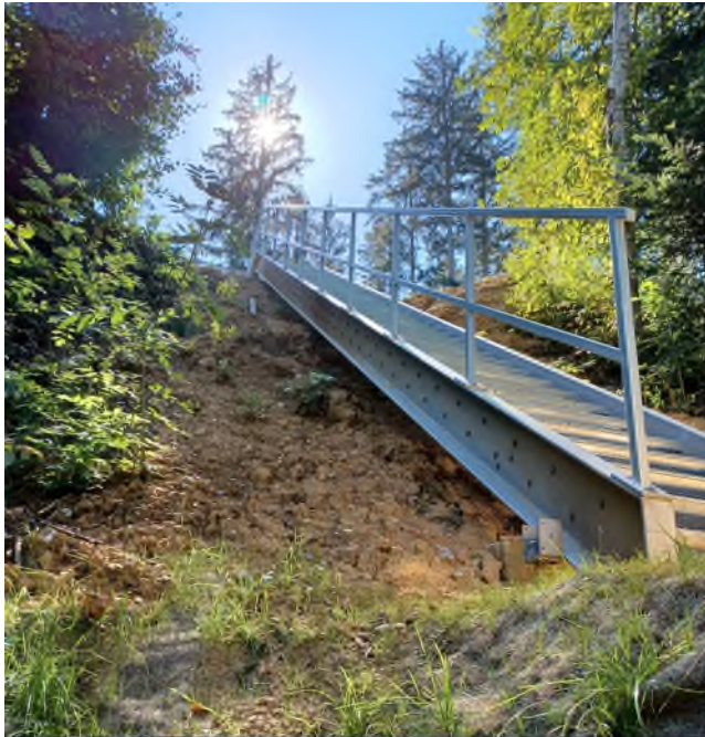
Bild 2 - Bildunterschrift: Die Teufelsküche Quelle Süd wurde runderneuert. Den Zuweg zur Quelle bildet jetzt eine neue, 12,5 Meter lange Stahltreppe.